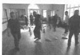
Atelier « Bien-Etre » : Sophrologie ;