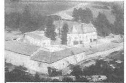
Abbaye de l'Étanche